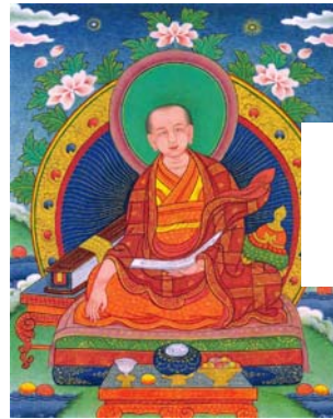
Tchekawa Yeshe Dordge